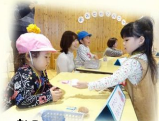
おみせやさんごっこ