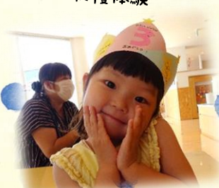
お誕生日のお祝い