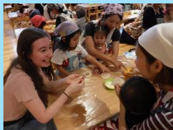
リトアニアのサウレ先生。伝統料理と一緒に作ったり、ダンスを教えてくださいました。

異文化交流を目的に海外からの受け入れを行っています。2012年より始まったこの活動、これまで20か国・28名の研修生を迎えました。保育の中で取り入れている英語だけではなく、ドイツ語やスペイン語などの言語に触れたり、さまざまな国の風習や考え方に触れたり・・・園児はもちろん職員や保護者にとっても異文化交流の大切な時間となっています。