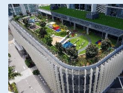
BlueBerries Childcare (ブルーベリーズチャイルドケア /ゴールドコースト)

オーストラリアでの保育園運営を通して、主体性・社会性・コミュニケーション能力の育みに注力した優れた保育を学び、日本の園でも一部を取り入れています。職員の研修先としても活用しており、今後は親子留学の受け入れ施設としても検討しています。