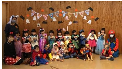
ハロウィンパーティ