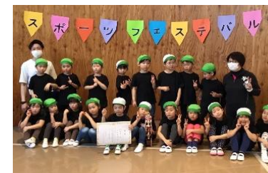
スポーツフェスティバル