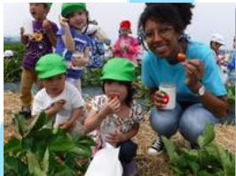
スペインのデシレー先生とはいちご狩りを楽しみました。