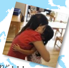
お別れは寂しいけれど・・・ 「また会おうね」スペインのヨリ先生との約束。