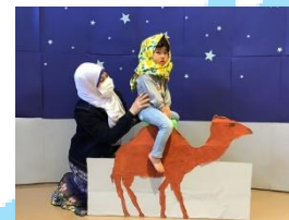
エジプトのアミラ先生と一緒にらくだづくりを楽しみました。