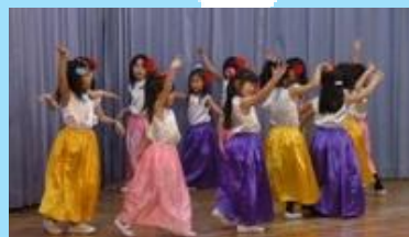
スペインから発祥のフラメンコ。保護者の方との交流会の他、園児たちも真剣に取り組みました。