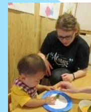
ポーランドのアカタ先生。一緒にポーランド食器の伝統に触れました。