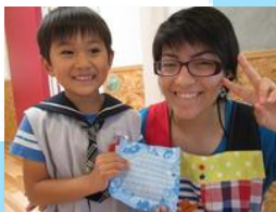
エクアドルのターニャ先生へ。想いをこめて、英語のお手紙のプレゼント。