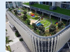
BlueBerries Childcare (ブルーベリーズチャイルドケア / ゴールドコースト)

オーストラリアでの保育園運営を通して、主体性・社会性・コミュニケーション能力の育みに注力した優れた保育を学び、日本の園でも一部を取り入れています。職員の研修先としても活用しており、今後は親子留学の受け入れ施設としても検討しています。