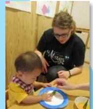
ポーランドのアガタ先生。一緒にポーランド食器の伝統に触れました。