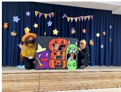
ハロウィンパーティ