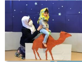
エジプトのアミラ先生と一緒にらくだづくりを楽しみました。