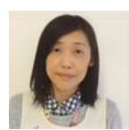
きない たかよ 記内 貴代